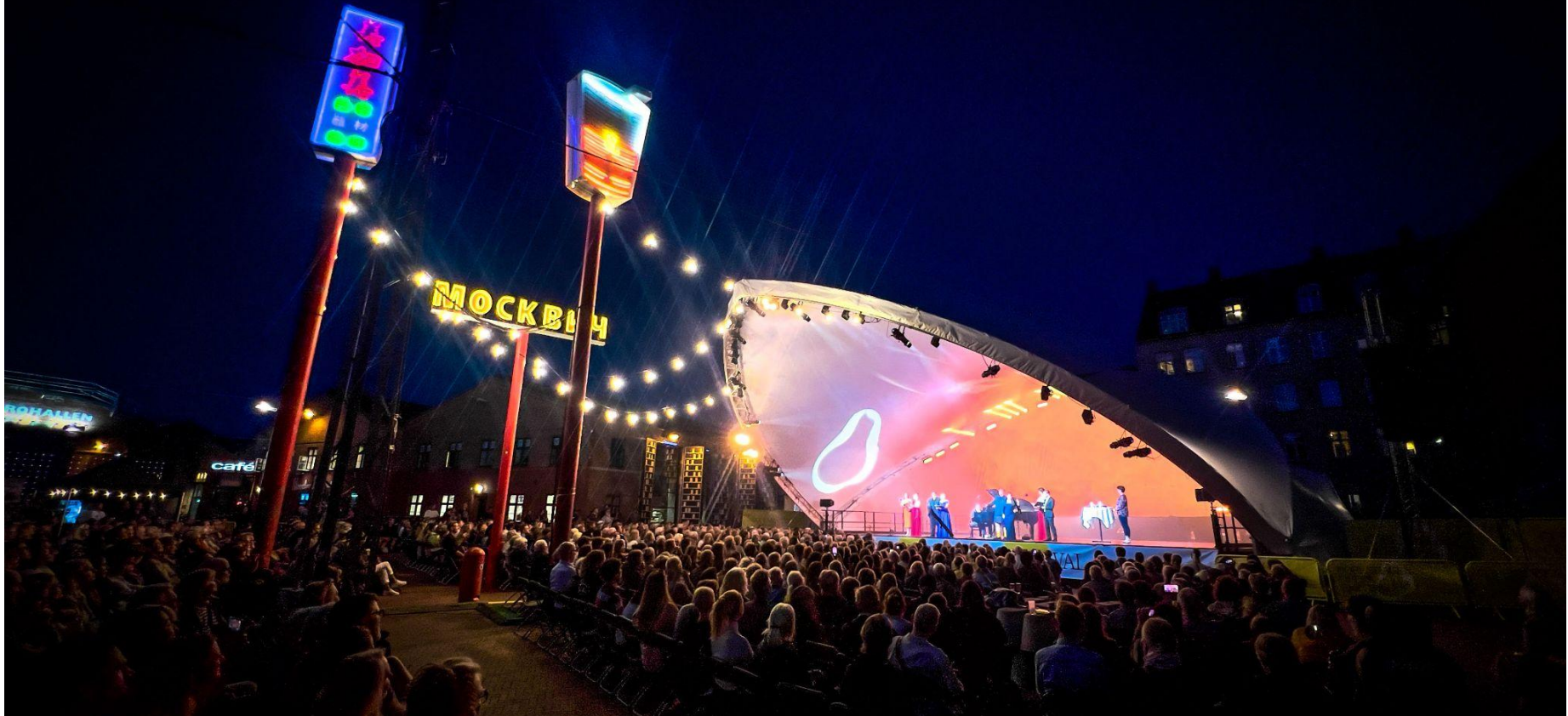
Foto: Damien Staton (2022). Hovedscene på Den Røde Plads, Nørrebro

På festivalens hovedscene på Den Røde Plads kunne man deltage i morgensang, opleve vokal mesterklassekoncert og de helt nye værker The Undoing of Carmen og Times up, Kong Knud! .